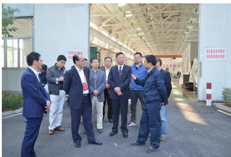
2018 年 10 月,教育部本科教学工作审核评估专家查看安庆师范大学中国人民解放军第 4812 工厂实践教育基地