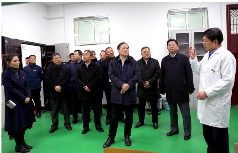
2020 年 12 月,中国工程院院士、科技部原副部长徐南平一行来我院调研指导

学院现有通信工程、电子信息科学与技术、微电子科学与工程、光电信息科学与工程、自动化、机械设计制造及其自动化、车辆工程等 7 个本科专业以及通信工程第二学士学位专业,其中,自动化专业为省级一流本科专业建设点、省级特色专业,电子信息科学与技术、机械设计制造及其自动化、光电信息科学与工程、通信工程等 4 个专业为省级卓越工程师培养计划专业,微电子科学与工程专业为省级专业结构调整与专业改造专业。学院拥有信息与通信工程一级学科硕士学位授权点、机械专业硕士学位授权点。