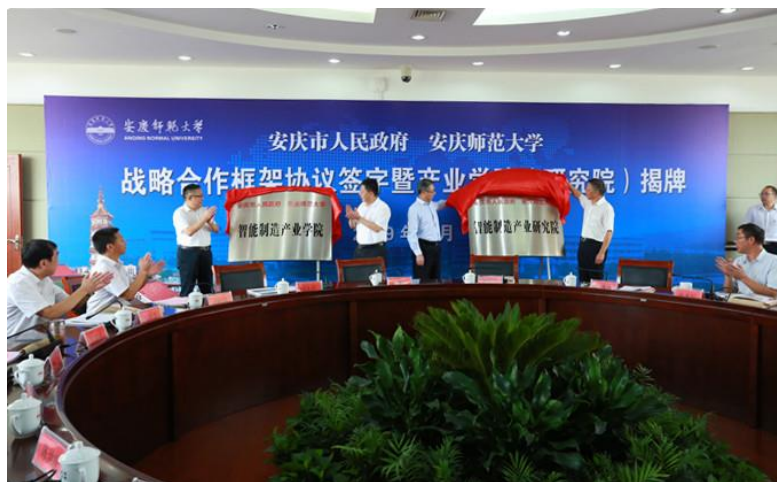
2019 年 8 月，我校与安庆市人民政府在龙山校区举行智能制造产业学院（研究院）揭牌仪式

学院在长期办学实践中形成了“产教融合、协同育人”的办学特色。建有省级工程实验室 1 个、省级实验实训中心 2 个、教育部产教融合创新基地 2 个。学校与安庆市人民政府共建智能制造产业学院（研究院），与安庆经济技术开发区共建智能制造协同创新中心。学院与企业联合共建实验室/研究中心 4 个。建有省级虚拟仿真实验教学中心 3 个、省级校企合作实践教育基地 3 个、省级创客实验室 1 个。建有专业实验室 63 个，实验室面积近 14800 平米，实验仪器设备总值近 5000 万元。共建 35 个校外实习实训基地。